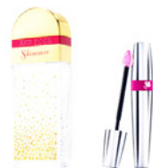
Doft från Elizabeth Arden & Lancomes läppfärg.

Shimmer. De är mycket olika och passar helt olika typer av kvinnor.