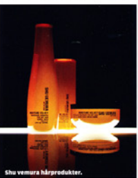
Shu Uemura hårprodukter.

Doffer för vardag och fest. Ett par dofter i det stora utbudet inför höst och vinter som vi verkligen gillar här på redaktionen är Naturel från Ralph Lauren och Red Door