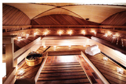
Bastu och pool på Luxury SPA , Hotel Reisen i Stockholm.

i vinter när luften är extra torr kan det vara bra att sätta gång med en crème som gör mytta på lång sikt. Pris 1 645 kr.